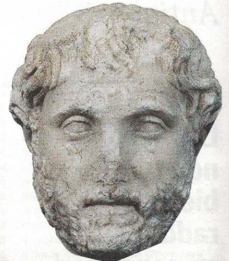
Alcune opere esposte alla Biennale di Roma. Qui sopra, testa maschile raffigurante Antonino Pio (138-161 d.C.) (Valerio Turchi); a sinistra, «Madonna con Bambino e santi» di Francesco D'Antonio (Fabrizio Moretti); qui accanto, «Burrasca» di Gerardo Dottori (Gian Enzo Sperone); sotto, «Concetto spaziale. Attese» di Lucio Fontana, 1960 (Robilant+Voena)